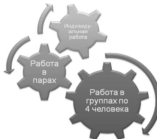
Рис. 1. Прием групповой работы «Снежный ком»

Идея приема «Снежный ком» представлена на рисунке 1: сначала учащиеся работают индивидуально, затем организуется работа в парах, далее две пары объединяются и работа продолжается в группе из 4 человек и т. д. В конце работы все учащиеся попадают в одну группу.