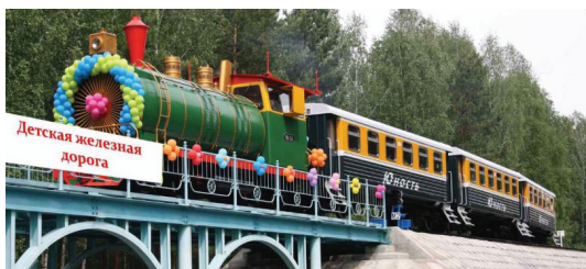
Рис. 8. Детская железная дорога, Новосибирск

Мощным инструментом социализации и инкультурации представляется еще один объект в отечественной культуре — детская железная дорога. Идея строительства железной дороги, на которой бы учились и работали дети, стала воплощаться в жизнь в период активной индустриализации страны — в 1930-е гг., когда были построены и введены в эксплуатацию Тбилисская и Днепропетровская детские железные дороги. В настоящее время в России функционирует 26 таких дорог, каждая из которых является не развлечением, а серьезным образовательным центром, в котором дети получают возможность познакомиться со всеми железнодорожными профессиями, получить технические знания, опыт самостоятельной трудовой деятельности (рис. 8).