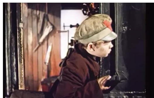
Рис. 5. «Миколка-паровоз». Кадр из фильма

В 1956 г. на киностудии Беларусьфильм была снята картина «Миколка-паровоз» (реж. Л. Голуб). Основным местом действия в фильме становится железная дорога, с ней связаны как ключевые моменты российской истории (здесь весь город встречает царский поезд, подпольщики разворачивают революционную пропаганду, партизаны вступают в борьбу с белогвардейцами), так и судьба главного героя, сына железнодорожного рабочего. По замыслу авторов фильма, мальчик совершает героический поступок — самостоятельно управляет паровозом, который должен спасти партизанский отряд (рис. 5).