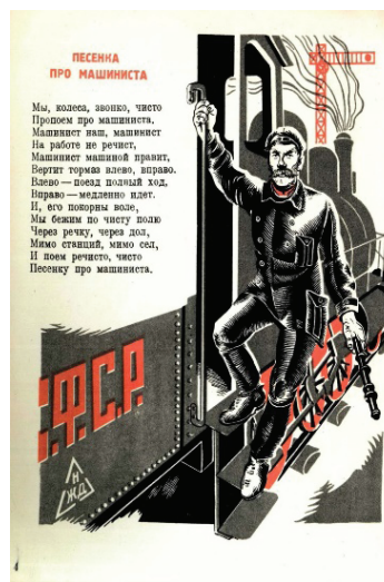
Рис. 3. М. Гинзбург. О чем пели колеса. Иллюстрация

ние М. Гинзбург «О чем пели колеса» состоит из «песенок» про машиниста, помощника машиниста, кочегара, стрелочника, сцепщика, телеграфиста, говорящих о значимости каждой профессии (рис. 3).