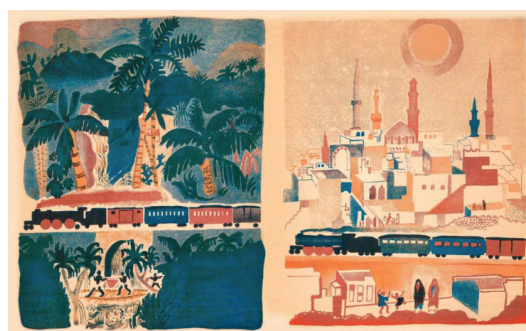
Рис. 4. Е. Л. Шварц. Поезд. Иллюстрации

Необходимо отметить иллюстрации к детским книгам данного периода. Стилистически разнообразные (что связано с наличием большого числа художественных течений в отечественном искусстве 1920-х гг.), они поддерживают и визуально закрепляют создаваемый словом образ, а иногда создают и собственное художественное пространство. Такова, например, книга «Поезд» (1929), в которой текст Е. Л. Шварца является, скорее, введением и заключением к серии красочных рисунков В. М. Ермолаевой (рис. 4). Главный герой всей художественной композиции — поезд, который пронесится через разные страны и континенты, показывая ребенку большой и сложный мир и делая этот мир доступным для освоения.