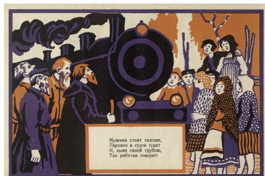
Рис. 1. Дядя Петро. Фу-ты, ну-ты, паровоз. Иллюстрация.

Мы сейчас устроим смычку. Всяк из вас неси сюда — По снопу иль по яичку, Молока иль толокна.