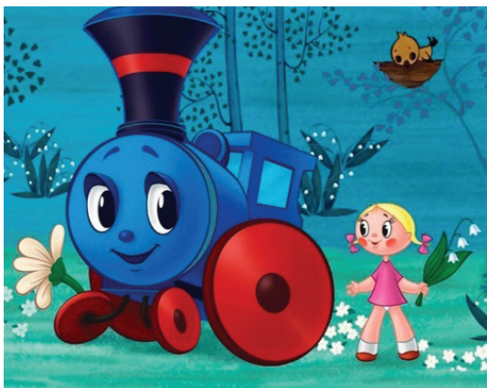
Рис. 6. «Паровозик из Ромашкова». Кадр из фильма

Самый известный советский мультфильм «железнодорожной тематики» — «Паровозик из Ромашкова» (1967 г., реж. В. Дегтярев). Это красочная история, в которой с помощью образа «ожившего» паровоза детям рассказывается об умении видеть красоту окружающего мира, удивляться и ценить ее (рис. 6).