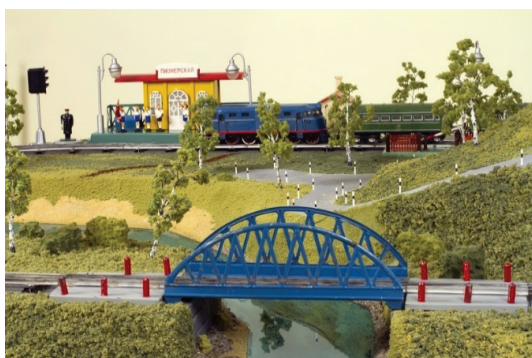
Рис. 7. Электрическая железная дорога

приобщиться к техническому творчеству (рис. 7). Производство игрушечных железных дорог до сих пор продолжается, современные компании создают и очень точные модели современной и ретро-техники, и копии паровозов — героев кинематографической индустрии (например, Хогвартс-экспресс от LIONEL, паровозики из Чаггингтона фирмы Leaning Curve). Это свидетельствует об актуальности образа железной дороги как для общества в целом, так и для детской аудитории. Игрушечная железная дорога стала уникальной игрушкой, способной развиваться вместе с обществом, его культурой и нести культурные ценности следующим поколениям.