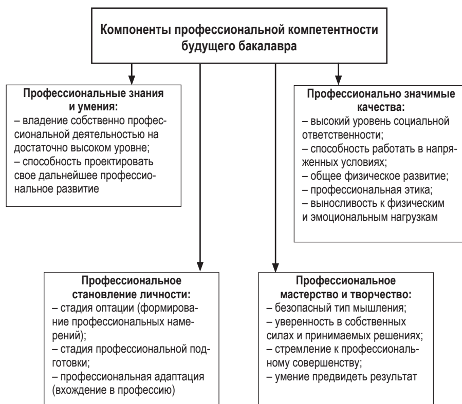
Рис. 1. Составляющие профессиональной компетентности будущего бакалавра техносферной безопасности

По мнению Ю. В. Ветровой, систему организации подготовки будущих специалистов техносферной безопасности — сотрудников Государственной противопожарной службы Министерства РФ по делам гражданской обороны, чрезвычайным ситуациям и ликвидации последствий стихийных бедствий (ГПС МЧС России) — следует рассматривать как комплекс форм, методов и средств обучения и воспитания будущих сотрудников МЧС в условиях ведомственного учреждения высшего образования Российской единой системы предупреждения и ликвидации чрезвычайных ситуаций, которые обеспечивают профессиональное становление и развитие интегративного состояния личности будущего специалиста, выраженного в готовности к профессиональной деятельности. Процесс формирования личности будущего сотрудника МЧС осуществляется через усвоение ею примеров реального поведения в критических ситуациях, норм, ценностей, требований к уровню безопасности со стороны социума [14; 15]. Ученый отмечает, что в подготовке специалистов техносферной безопасности важно применение активных методов и форм обучения для овладения