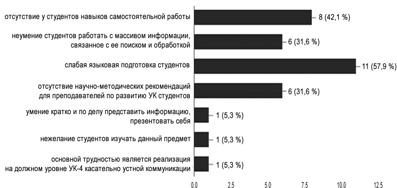
Рис. 1. Ответы преподавателей на вопрос «Назовите основные трудности, с которыми Вы сталкиваетесь при формировании УК студентов»

Такой формат сотрудничества преподавателей не только позволил актуализировать основные трудности и дефициты методического характера, связанные с формированием